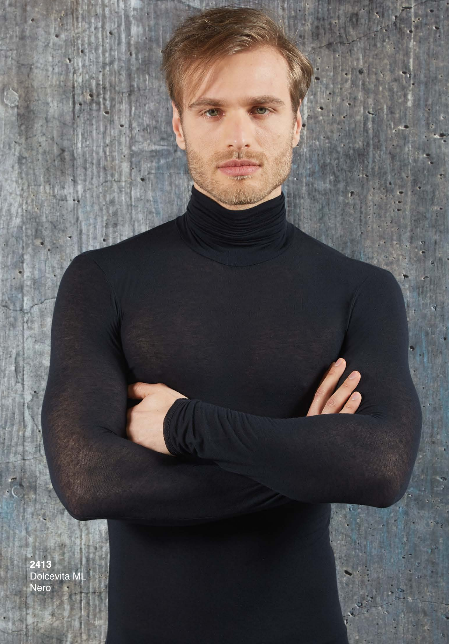
2413 Dolcevit ML Nero