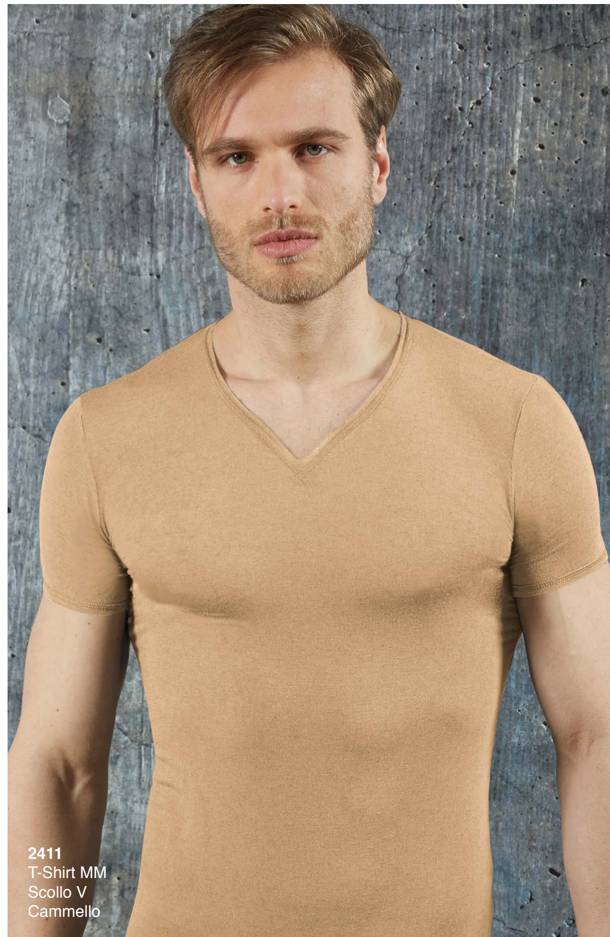
2411 T-Shirt MM Scollo V Cammello