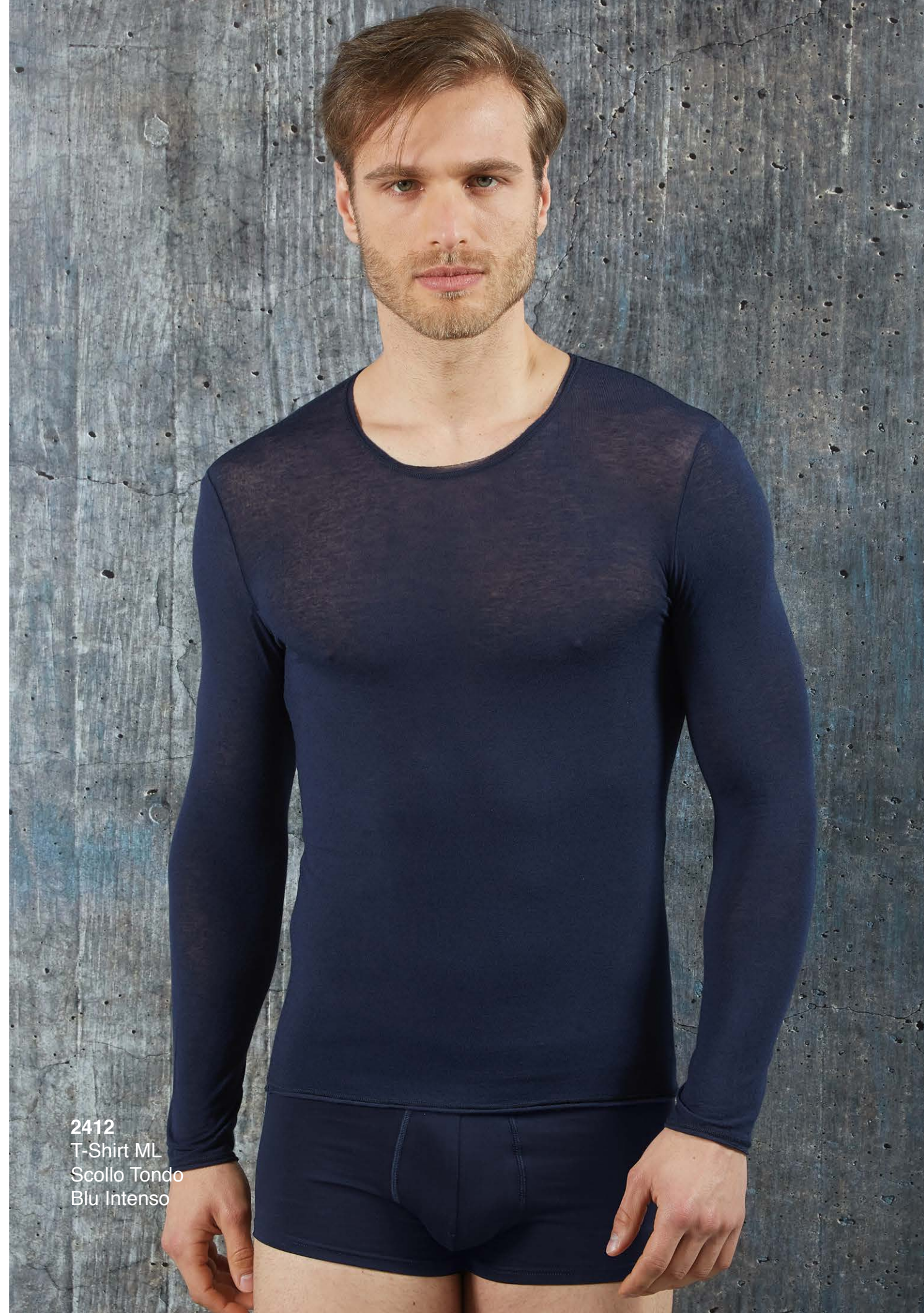
2412 T-Shirt ML Scollo Tondo Blu Intenso